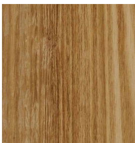
Eukalyptus Gegenzug Ungeschliffen 0,9 mm | 0,6 mm 3100 x 1250 mm* | 3100 x 1250 mm* Gegenzug / Blind

Das Sortiment FURNIER-EXPRESS Fixmasse wird laufend erweitert.