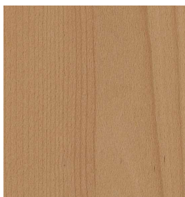
Buche Geschliffen 0,9 mm 2600 x 1250 mm* A-Qualität Rift / Halbrift