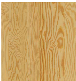
Seekiefer Geschliffen 0,9 mm 2800 x 1250 mm A-Qualität Geschält