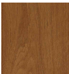
Eiche Rustic Antik Geprägt / Gebürstet 0,9 mm 2440 x 1220 mm A-Qualität Rift / Halbrift / Blume