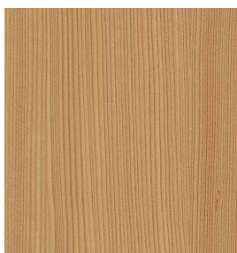
Lärche Geschliffen 0,9 mm 3100 x 1250 mm* A-Qualität Rift / Halbrift