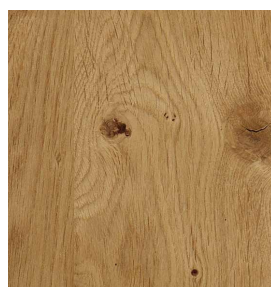
Eiche Rustic Natur Geprägt / Gebürstet 0,9 mm 2440 x 1220 mm A-Qualität Rift / Halbrift / Blume