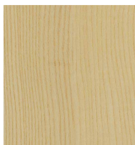
Esche Geschliffen 0,9 mm 3100 x 1250 mm* A-Qualität Rift / Halbrift