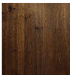
Eiche Rustic Mokka Geprägt / Gebürstet 0,9 mm 2440 x 1220 mm A-Qualität Rift / Halbrift / Blume