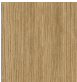
Eiche Geschliffen 0,9 mm | 0,6 mm 3100 x 1250 mm* | 3100 x 1250 mm* A- und B-Qualität Rift / Halbrift