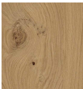
Eiche astig Geschliffen 0,9 mm 3100 x 1250 mm* A-Qualität Rift / Halbrift / Blume