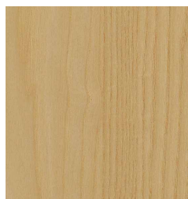
Esche Blume Geschliffen 0,9 mm 3100 x 1250 mm* A-Qualität Blume