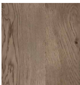
Eiche Rustic Stone Geprägt / Gebürstet 0,9 mm 2440 x 1220 mm A-Qualität Rift / Halbrift / Blume