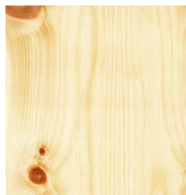
Arve Astig 1,4 mm 3100 x 1250 mm* A-Qualität Rift / Halbrift / Blume