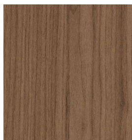
Nussbaum US Geschliffen 0,9 mm 3100 x 1250 mm* A-Qualität Rift / Halbrift