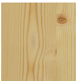
Fichte astig Geschliffen 0,9 mm 3100 x 1250 mm* A-Qualität Rift / Halbrift / Blume