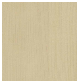
Ahorn Geschliffen 0,9 mm 3100 x 1250 mm* A-Qualität Rift / Halbrift