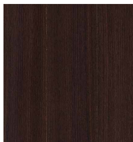
Eiche geräuchert Ungeschliffen, ohne Vlies 0,9 mm 3100 x 1250 mm* A-Qualität Rift / Halbrift